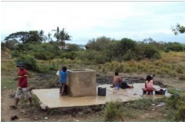
井戸で水汲みや洗濯をする島の子どもたち。

トレスレイエスはフィリピンで10番目に大きいボホール島の港町ウバイからモーターボートで北東へ約25分の位置にある小さな島。一時間もあれば十分歩いて一周出来るほどの小さな島に103世帯、およそ450人もの人々が住んでいる。その半分以上は子どもだ。