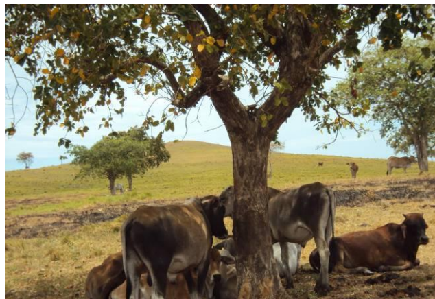
島には何百頭もの牛がいる。暑い日中は日陰で休んでいた。

この広い草原に何百頭もいる牛は井戸からの水を運んだりするなどの日常の仕事に使われる。牛以外にも山羊、鶏、犬、猫、豚といった家畜がどの家にも多くみられた。残飯の処理や食用といった島での生活に重要な役割をそれぞれの家畜は果たしているが、一方でその数の多さも問題となっている。例えば、つながれていない牛が小学校の授業の妨害となったり、今回の植林のために育てていた苗木を山羊が食べてしまったり鶏が蹴飛ばしてしまったりしたそうである。