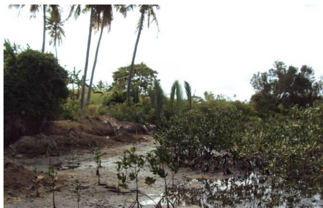
Tang-Tang 地域の家の裏に植えられたマングローブ

周りが一周海に囲まれているにも関わらず、島の沿岸に生えるマングローブはさほど多くない。海岸線を歩くとマングローブ違法に伐採された痕が目立つ。その中でも焦げた痕があるものは、一度火を入れて切りやすくした後、燃料用に伐採したものだと村の人は語っていた。かつてはこの島はもっとマングローブに覆われていたが、このような過伐採のために減少した後は防波林がなくなり、台風などの被害を受けやすくなったという。そのようなことを懸念し、Tang-Tang 地域においては個人で自発的にマングローブ植樹を去年から始めた家もあった。